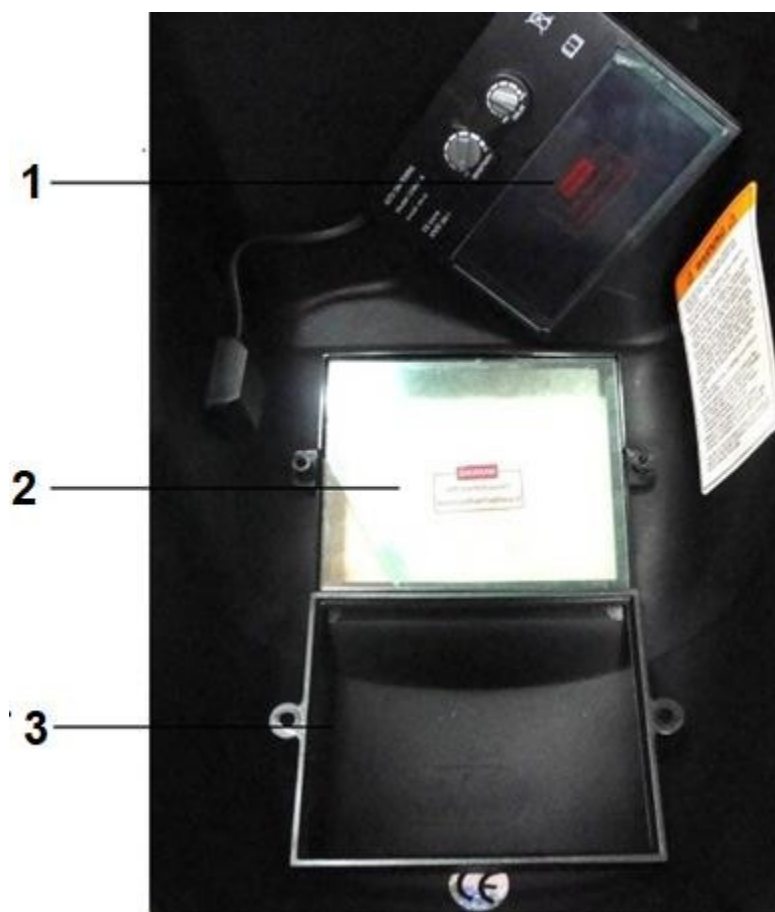
1. Filtru de atenuare