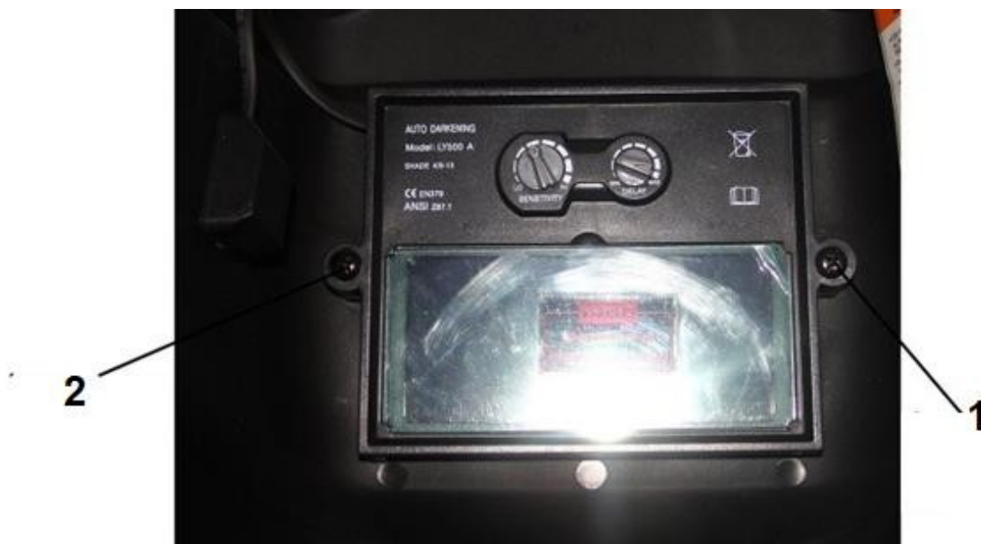
1. Șurub de fixare a cadrului filtrului 2 . Șurub de fixare a cadrului filtrului

Capacul exterior se înlocuiește prin deșurubarea celor 2 șuruburi care fixează cadrul. După ce ați slăbit rama trebuie să ridicați întregul filtru, sub care se află capacul filtrului frontal.